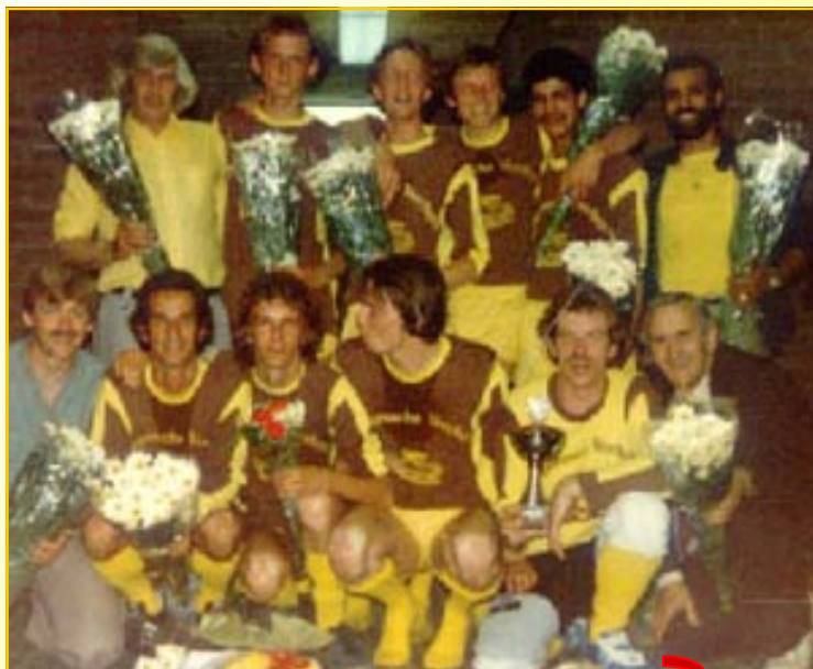
Op de kampioensfoto:

Uiteindelijk was het verschil met de naaste concurrenten Lindenboom en FC Bik groot.