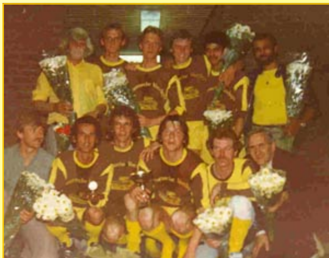
Op de kampioensfoto: